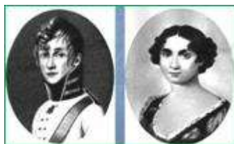
Родители И.С. Тургенева