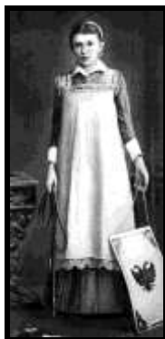
Актриса М.Г. Савина в пьесе И.С. Тургенева «Месяц в деревне»