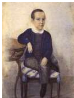
И.С. Тургенев в детстве