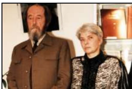
А.И. Солженицын с женой