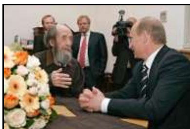
А.И. Солженицын и В.В. Путин